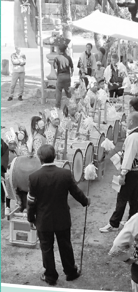
上原八幡神社例大祭の様子

URL http://www.shobara.or.jp/ e-mail sccl@shobara.or.jp