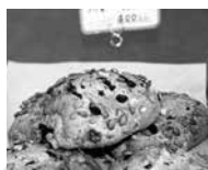
ライ麦クルミレーズン ひまわりの種