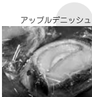
アップルデニッシュ