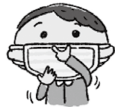
鼻と口の両方を 確実に覆う