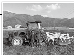
実証実験で使用しているトラクターとドローン